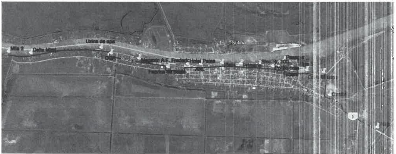
Plan de incadrare in zona statii de autobuz propuse pe TRASEU RETUR