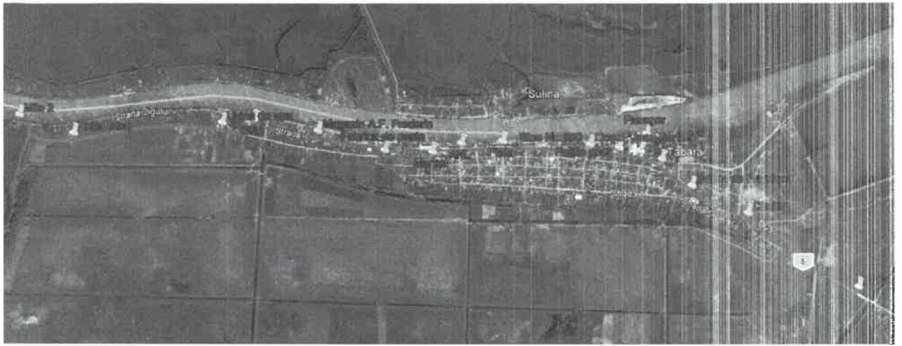
Plan de incadrare in zona statii de autobuz propuse pe TRASEU TUR